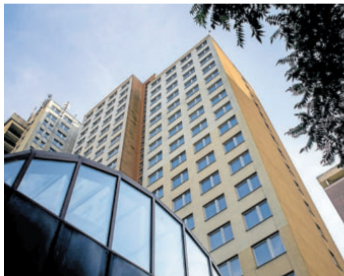
VZNIKNE GHETTO? Hotel Opatov na Jižním Městě nabídne sociální bydlení.

Současné vedení tamní radnice, tvořené koalici ANO, TOP 09 a ČSSD, ale s komplexní opravou chátrající budovy souhlasí. Takzvaný Dům pro nový začátek má poskytnout ubytování lidem s nízkými, ale pravidelnými příjmy, a podle magistrátu má jít o „vyvážený mix“ mladých rodin, handicapovaných, seniorů atd. „Proměnou struktury obyvatelstva dojde k zásadnímu zvýšení bezpečnosti místa i přilehlého okolí, jehož revitalizace je ostatně nedílnou